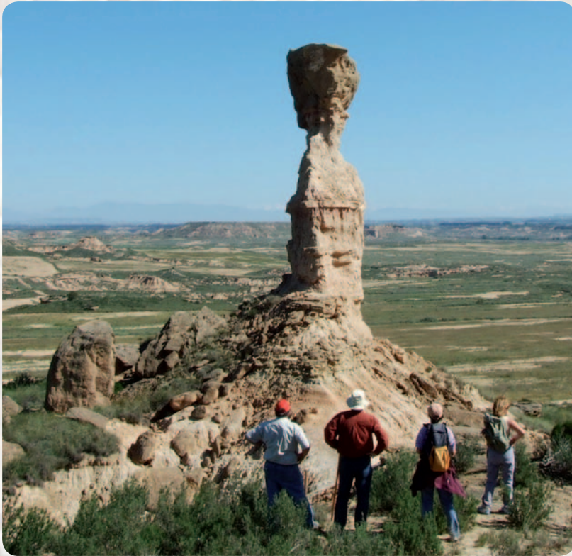
Tozal de la Cobeta