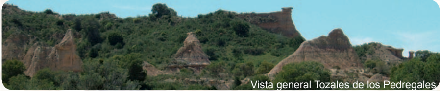
Vista general Tozales de los Pedregales