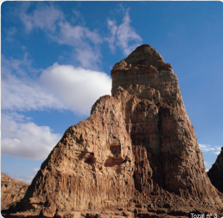
Tozal n° 3